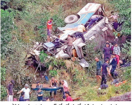
సోమవారం ఉత్తరాఖండ్ లో లోయలో పడిన బస్సు దృశ్యం

మాజీ సర్పంచ్ల సమరశంఖం బకాయిలు చెల్లించాలని డిమాండ్ వారి ఆందోళనకు కెటిఆర్, హరిష్ మద్దతు ఎక్కడికక్కడే అరెస్టులు చేసిన పోలీసులు తిరుమలగిరి పోలీస్ స్టేషన్లో ఆందోళన చేస్తున్న మాజీ మంత్రి హరిష్ రావు, ఇతర బిఆర్ఎస్ నేతలు హైదరాబాద్, నవంబరు 4: ప్రభాతవార్త: పెండింగ్ బిల్లులు విడుదల చేయాలంటూ రాష్ట్రవ్యాప్తంగా మాజీ సర్పంచ్లు నిరసనలు చేపట్టారు. హైదరాబాద్ జూబ్లీహిల్స్ పెద్దమ్మ తల్లిని సోమవారం దర్శించుకున్న అనంతరం ముఖ్యమంత్రి రేవంత్ రెడ్డి నివాసానికి వెళ్లి వినతి వ్రతం ఇవ్వాలని నిర్ణయించారు. అయితే మాజీ సర్పంచ్లందరికీ పోలీసులు ఎక్కడిక్కడే హోజా అరెస్టులు చేయగా, కాండరిని జబ్బిహిల్స్ లో అరెస్టు చేసి వివిధ పోలీసు స్టేషన్లకు తరలించారు. అప్పులు తెప్పి గ్రామాల్లో శ్మశానవాటికలు, క్రీడా ప్రాంగణాలు, డంపింగ్ యార్డులు వంటి అనేక అభివృద్ధి పనులు చేసినట్లు సర్పంచ్లు వాపోయారు. చేసిన అభివృద్ధి పనులకు సంబంధించి 2019నుంచి 2024వరకు బిల్లులు రాబేసిన ఆవేదన వ్యక్తం చేశారు. స్థానిక సంస్థల ఎన్నికలు పన్ను సేవలతో >>2